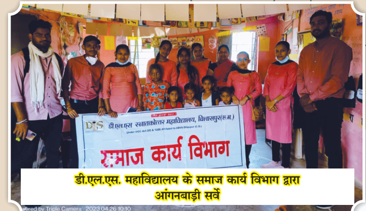
डी.एल.एस. महाविद्यालय के समाज कार्य विभाग द्वारा आंगनबाड़ी सर्वे