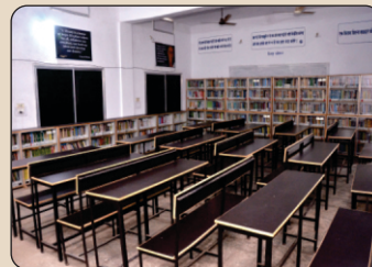
Library Student Study Area