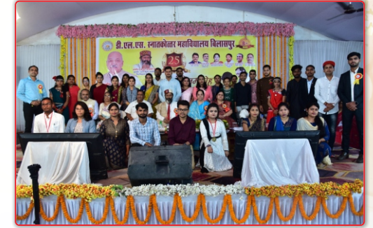
शहीद अविनाश शर्मा स्मृति पदक से सम्मानित डी.एल.एस. महाविद्यालय के छात्र-छात्रायेँ