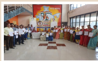
Eye Donation Camp