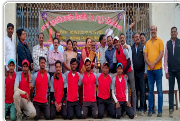
अर्न्त महाविद्यालयीन बेसबॉल(पुरुष) प्रतियोगिता 2022 में डी.एल.एस. महाविद्यालय उपविजेता