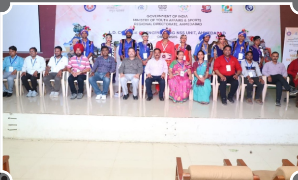
राष्ट्रीय एकता शिविर (अहमदाबाद) में राज्य रा.से.यो. का नेतृत्व, डी.एल.एस. महाविद्यालय द्वारा

Prepare students to take an active role, professionally, in addressing social problems and to challenge social and economic injustice. Analyze issues and develop social policies that further social and economic justice goals within human service agencies, organizations, communities and society