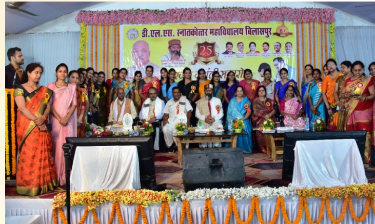
डी.एल.एस. महाविद्यालय के समस्त शिक्षकगण एवं स्टाफ