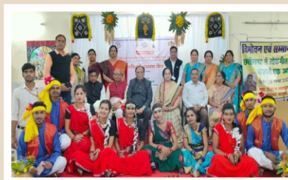
Departmental Cultural Activity