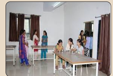
Girls Common Room