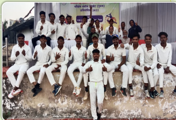
परिक्षेत्र स्तरीय क्रिकेट (पुरुष) प्रतियोगिता डी.एल.एस. महाविद्यालय (सेमी फाईनलिस्ट)