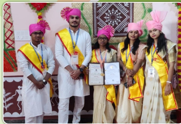
अटल बिहारी वाजपेयी विश्वविद्यालय बिलासपुर के दीक्षांत समारोह में गोल्ड मेडल से सम्मानित महाविद्यालय के छात्र - छात्रायेँ