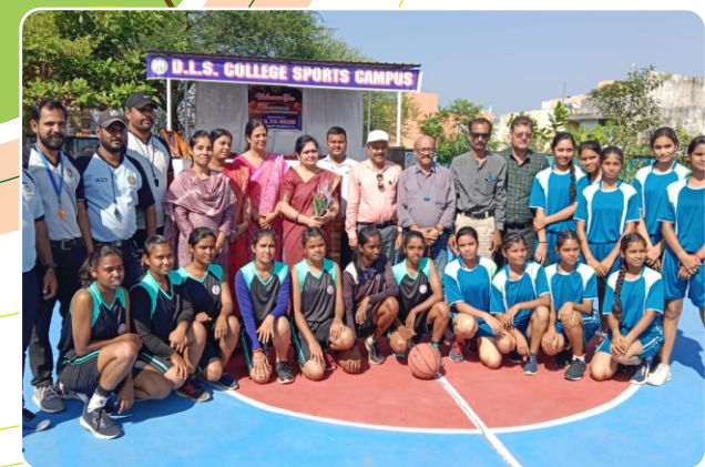
इन्टर कॉलेज महिला बॉसकेट बाल प्रतियोगिता 2022 विजेता डी.एल.एस. महाविद्यालय