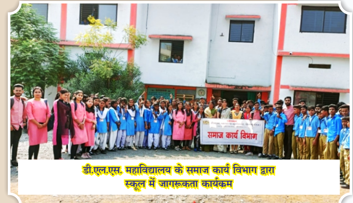
डी.एल.एस. महाविद्यालय के समाज कार्य विभाग द्वारा स्कूल में जागरूकता कार्यक्रम