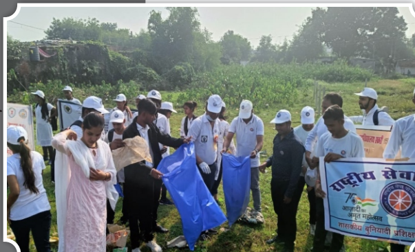
स्वच्छ भारत मिशन 2.0 में डी.एल.एस. महाविद्यालय के रा.से.यो. इकाई द्वारा स्वच्छता अभियान