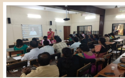
Faculty Development Program